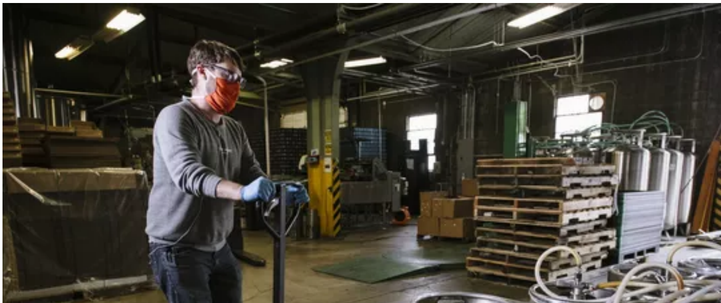
28/09/2021 10:09 — Em Finanças