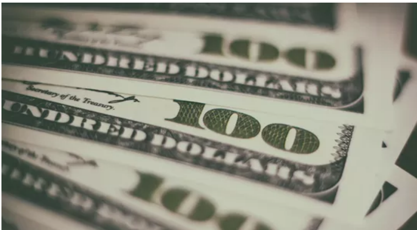
28/09/2021 09:59 — Em Finanças